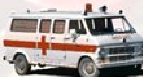
Пожарные, милицейские, скорая помощь, спецмашины