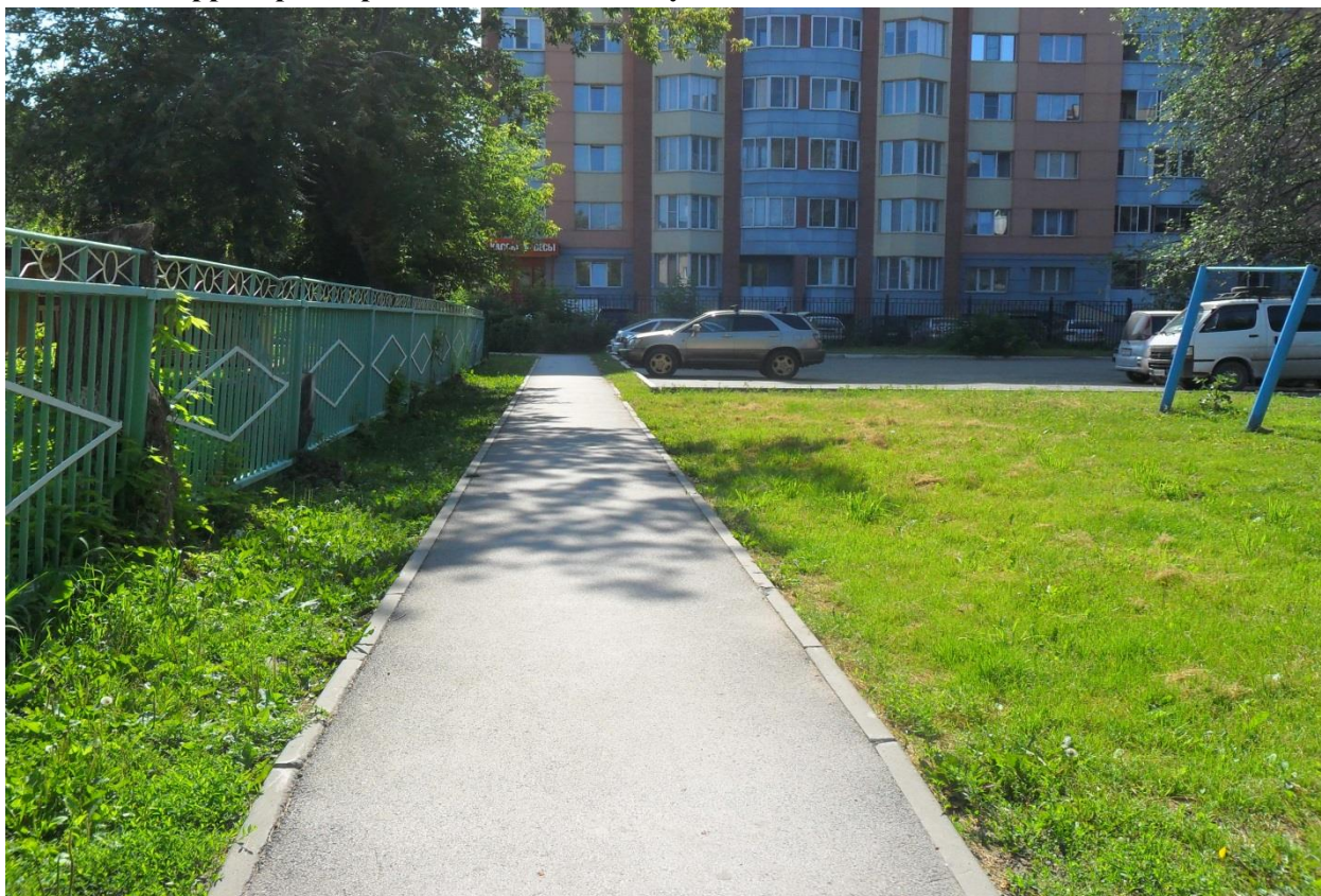
Фото № 1 Территория, прилегающая к объекту