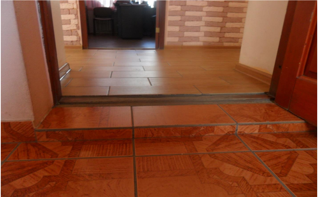
Фото № 3. Пути движения в здании